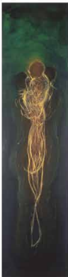
Družina, vodene barvice na platnu, 240 x 60, 2000