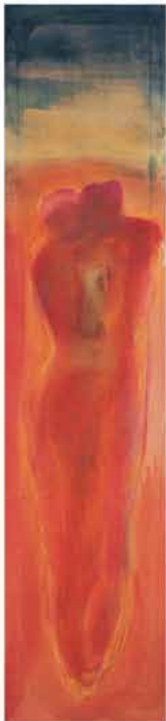
Motiv ustvarjalec-zapiscovalec. Podoba človeka pri delu, pisanju, risanju, uradovanju ... v trenutku ko narejeno pogleda 1999

Dotiki Čopič na papirju! Barva v vodi! Duša v telesu, navdušenje drugega v plesu. Čutiš ta čudoviti vznik oblin in oblik v trenutku, ko se iz svetlih lin rojeva nov lik? O kakšna obljuba je v teh preprostih potezah moč poljuba.