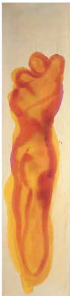
Perspektiva, vodene barvice na platnu, 200 x 180, 2000

Diptihi so mi že od nekdaj blizu, saj dvoje povežejo v celoto. Na levi polovici stoji moška figura, na desni ženska. Stojita si nasproti v pokrajni, katere del sta: dve bitji..., dva pogleda..., dve predstavi... Srečata se. Ko se jima bližam, se zblížujeta med seboj. Bližje ko sem, težje ju ločim. Ko ju spregledam, vem, da ju ne morem več ločiti. Bližina in pogled sta ju povezala za vedno. Ona nosi del njega in on del nje. Ali ni v tej podobi zajeto slehernozbližanje nasprotij in zlitja v celoto: ženske in moškega, jin in jang, vzhodne in zahodne perspektive...?